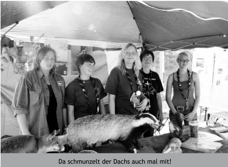
Da schmunzelt der Dachs auch mal mit!

ohne diejenigen, die diese nachhaltig bewirtschaften und somit gestalten.“ 30 Vereine und Verbände gaben Einblicke in ihre Arbeit an sehenswerten Ständen. Die Windfuser Naturschützer zeigten auch in Wiehl wie vielseitig ihr Wirken im Oberbergischen Land ist. Wieder einmal war das Naturschutzgebiet Puhlbruch-Silberkuhle Ziel von Forstfachleuten. Revierleiter Daniel Müller-Habbel konnte 20 Gäste aus dem Solling begrüßen und Ihnen bei einer Führung die Besonderheiten des