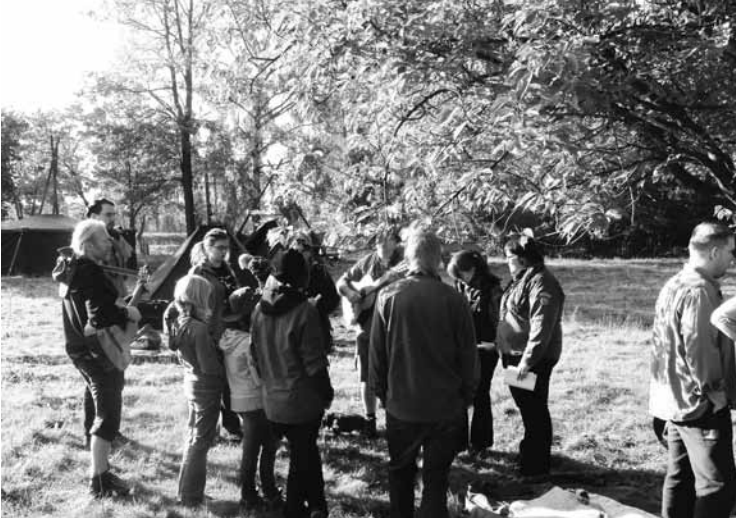
Die Lagebesprechung steht am Anfang eines arbeitsreichen Tages.

erreichten das Lager gegen Mitternacht. Doch das Wiedersehen mit den anderen Waldläufern ließ die Anreise unter freiem Himmel begonnen. Die am vorabendlichen Feuer geprobt, Lieder kamen bei der Pfarrerin gut an.