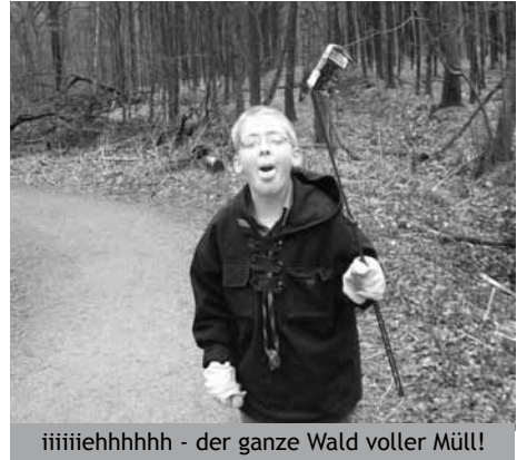
iiiiiehhhhh - der ganze Wald voller Müll!

Noch in den Sommerferien waren wir bereits wieder tätig, indem wir mit einer Abordnung beim Kirchhellener Brezelfest teilnahmen. Mit dem Ende der Ferien gingen dann die Gruppenstunden auch wieder los und damit näherten sich die Vorarbeiten für unsere traditionellen Weihnachtsmärkte mit Nistkastenbau für Höhlen - und Halbhöhlenbrüter sowie Futterhäuser - und Krippenbau. Nebenbei sammelten wir auch Springkrautblütenblätter und Holunder - sowie Ebereschenbeeren für entsprechende Säfte, Liköre und Marmeladen. Bei verschiedenen Aktionen wie unserem örtlichem Holz Tag am Heidhof wo wir mit Nistkastenbau vertreten waren oder beim