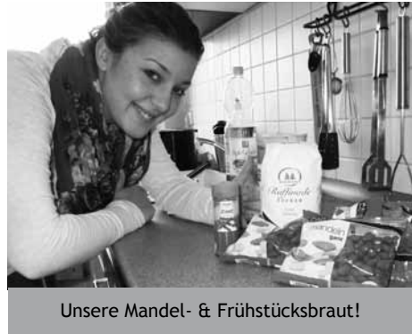
Unsere Mandel- & Frühstücksbraut!

Leider reichen unsere geistigen Fähigkeiten am letzten Tage nicht mehr aus, um den Epilog nun fortgehend zu reimen. Wir bitten dies zu entschuldigen. Während unserer Redaktionssitzung haben wir keine Kosten und Mühen gescheut, das zu erproben was wir euch hier anpreisen.