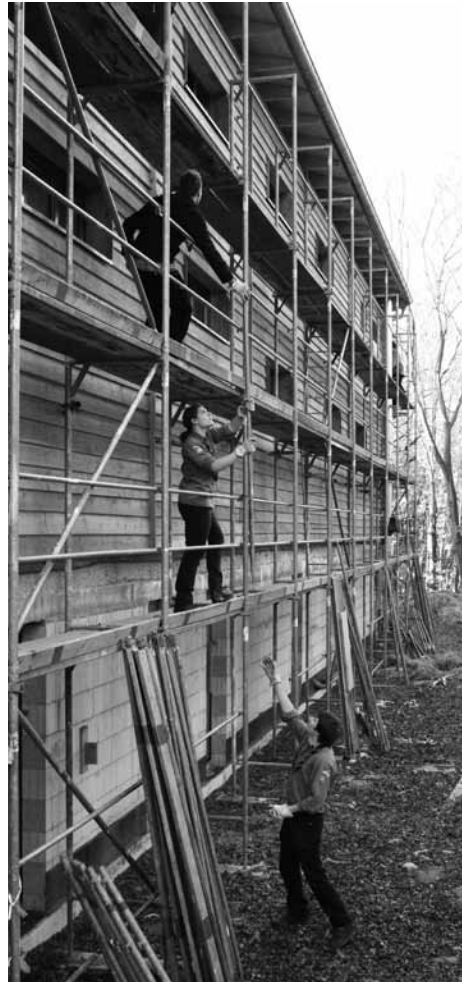
Da möchte jemand hoch hinaus!